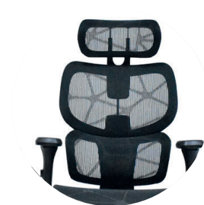
Espaldar en malla Nylon con diseño.