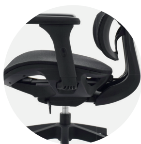
Mecanismo syncro 4 bloqueos.