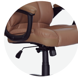
Up and down