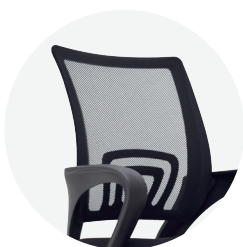
Espaldar en malla