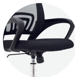
Espuma laminada y tapizada